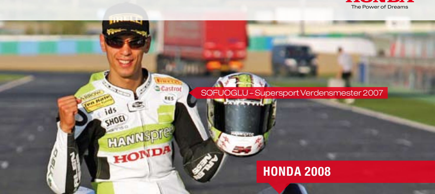
SOFUOGLU - Supersport Verdensmester 2007