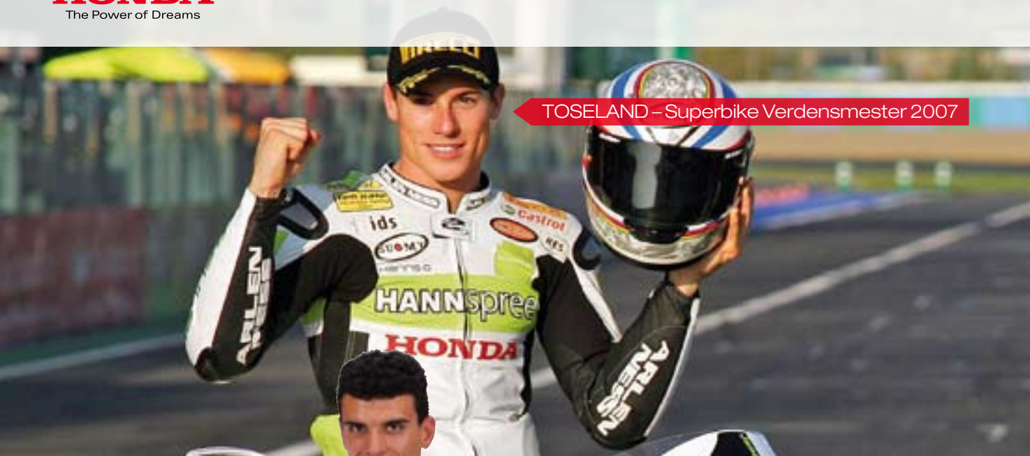
TOSELAND – Superbike Verdensmester 2007